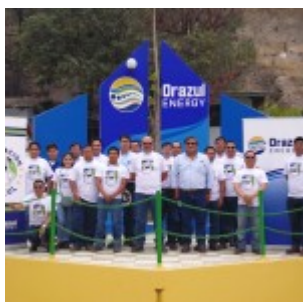
Tripulación Cañón del Pato